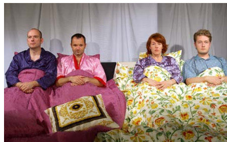
Szene aus „Das Kuckucksei“

Das 1954 gegründete Kellertheater zog 1966 in das Haus Karl-Muck-Platz 1, seit 1997 Johannes-Brahms-Platz 1. Während das Ensemble inzwischen aus circa 90 Mitgliedern besteht, umfasst das ständige Repertoire 10 bis 15 Stücke: hauptsächlich modernes Literatur-Theater, aber auch Klassiker, Musicals, Kindertheater und Lesungen.