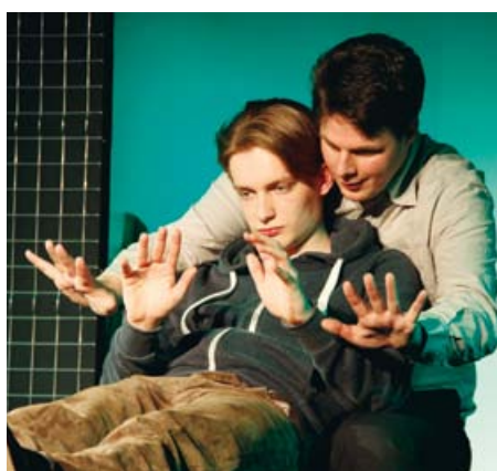
Szene aus „Einer wie Kaspar Hauser“