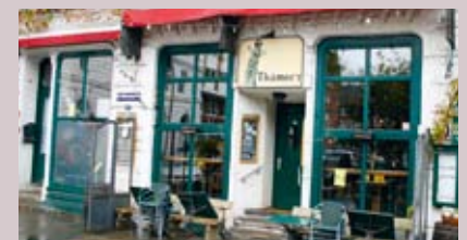
Thämers Kohlhöfen 10, 20355 Hamburg

Wochentags von 12:00 bis 24:00 Uhr (freitags Open End) sowie samstags und sonntags ab 11:00 Uhr bietet das urige Thämers Gerichte der deutschen Küche, modern interpretiert. Spezialitäten des Hauses sind die vegetarischen Bratkartoffeln und der saftige „Eva-Burger“. Seit 30 Jahren, direkt am Großneumarkt mit Blick auf den Michel gelegen, ist das Thämers Anlaufstelle für ein bunt gemischtes Publikum. Neben dem leckeren Speiseangebot kann das Thämers seit Kurzem auch wieder mit einer Weinstube im Souterrain punkten.