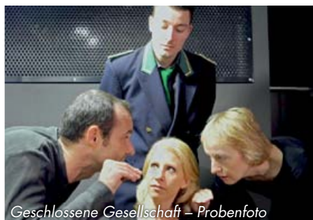
Geschlossene Gesellschaft – Probenfoto

Das 1954 gegründete Kellertheater zog 1966 in das Haus Karl-Muck-Platz 1, seit 1997 Johannes-Brahms-Platz 1. Während das Ensemble inzwischen aus circa 90 Mitgliedern besteht, umfasst das ständige Repertoire 10 bis 15 Stücke: hauptsächlich modernes Literatur-Theater, aber auch Klassiker, Musicals, Kindertheater und Lesungen.