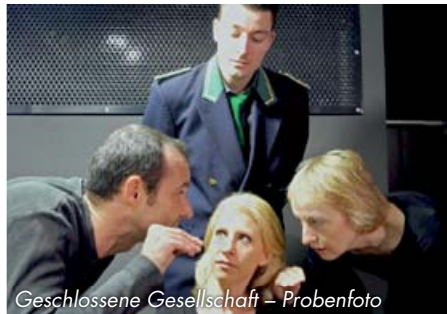
Geschlossene Gesellschaft – Probenfoto

Das 1954 gegründete Kellertheater zog 1966 in das Haus Karl-Muck-Platz 1, seit 1997 Johannes-Brahms-Platz 1. Während das Ensemble inzwischen aus circa 90 Mitgliedern besteht, umfasst das ständige Repertoire 10 bis 15 Stücke: hauptsächlich modernes Literatur-Theater, aber auch Klassiker, Musicals, Kindertheater und Lesungen.