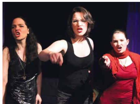
Szene aus „Germanys next Casting-Show“

Den aktuellen Spielplan können Sie unter www.kellertheater.de einsehen.