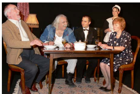
Szene aus „Biedermann und die Brandstifter“

Das 1954 gegründete Kellertheater zog 1966 in das Haus Karl-Muck-Platz 1, seit 1997 Johannes-Brahms-Platz 1. Während das Ensemble inzwischen aus circa 90 Mitgliedern besteht, umfasst das ständige Repertoire 10 bis 15 Stücke: hauptsächlich modernes Literatur-Theater, aber auch Klassiker, Musicals, Kindertheater und Lesungen.